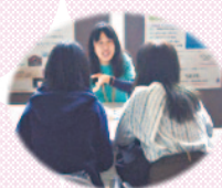
理系女子コーナー

理系進学を考えている、理系か文系かを迷っている 女子高校生、女子中学生 保護者、教員も歓迎